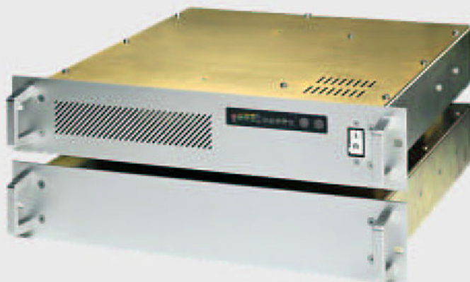
Europa RM Modelos 2000/3000 VA (baterías en cabina externa)