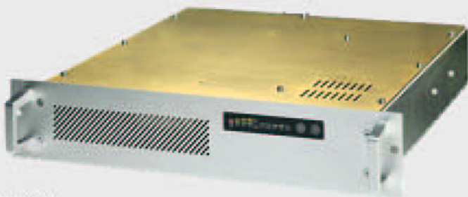
Europa RM Modelos 700/1000/1500 VA (baterías internas)

El Sai de la Serie Europa RM es un avanzado sistema de alimentación ininterrumpida verdadero on-line doble conversión , con onda senoidal pura en salida y totalmente independiente de la red, controlado por un Microprocesador Inteligente. Gracias a que incorpora lo último en tecnología digital, ofrece una alimentación eléctrica totalmente estabilizada, libre de microcortes, ruidos y parásitos, estando recomendado para proteger sus sistemas informáticos más delicados; incluso en condiciones extremas de la red eléctrica. Incluye un avanzado diseño de comunicaciones RS 232, compatible con el más sofisticado software de monitorización.